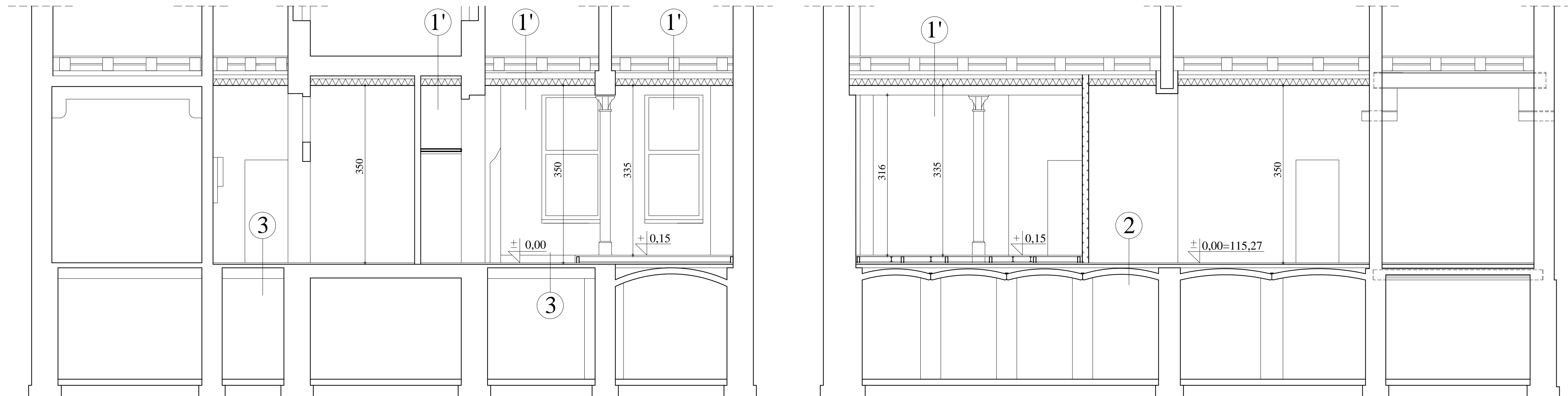
PRZEKRÓJ B-B skala 1:50